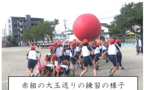
赤組の大玉送りの練習の様子