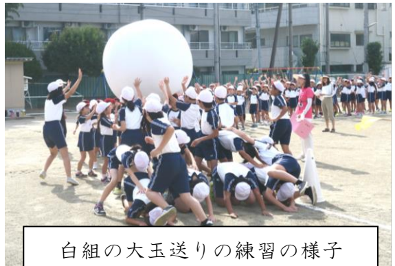
白組の大玉送りの練習の様子

9月14日（木）の朝には、全校練習として入場行進と開閉会式の練習が、15日（金）の朝には、大玉送りの練習がそれぞれありました。運動会のテーマ通り、赤組も白組も仲間と協力しながら、勝利を目指して懸命に頑張っていました。そうした中で、思い出に残るような素晴らしい運動会となり、子ども達はこの運動会を通して心も体も大きく成長することでしょう。そのような運動会になることを期待しています。