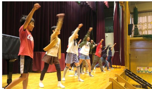
児童会の「ゆかいな仲間たち」の活躍

今年度は6年生が7学級37名しかいなくて、昨年度の6年生の約半分の数です。しかし、子どもたち一人一人が強い意欲と責任感を持って取り組み、人数の少なさを感ずることはありませんでした。本校の今年度の教育方針の一つに「人に貢献できる人を育てる」というものがありますが、6年生の活躍はそれを体現したものでした。例えば、「猛獣狩りへ行こうよ」という指定した人数で集まるゲームをしましたが、児童会役員が「ゆかいな仲間たち」と称してステージ上で元気いっぱい踊りながら先導して全員で楽しく踊ったり、指定した人数で集まる場所では、自分たちが楽しむのではなく、6年生は人数に入れずに各グループに入って5年生以下の子どもたちに声かけをして子どもたちを集めたりするなど積極的にリードしました。その積極的な姿勢に、とても感心しました。そうした6年生の姿勢を感じ取り、5年生以下の子どもたちも1年生に楽しんでもらおう、舞鶴小学校に早く慣れてもらおうという気持ちのあふれた素晴らしい集会となりました。