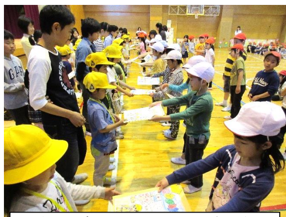
全校児童の歓迎の想いのこもったプレゼントを1年生に渡す2年生