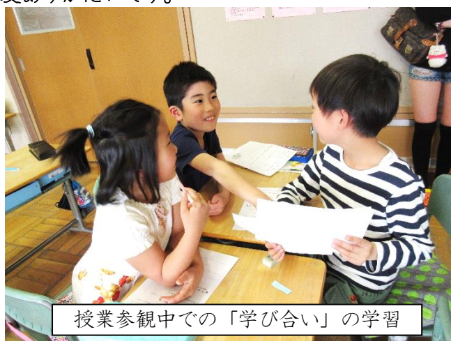
授業参観中での「学び合い」の学習

保護者の皆様も、是非、学校の取り組みをご理解いただき、同じ方向でご指導をいただければ大変ありがたいです。